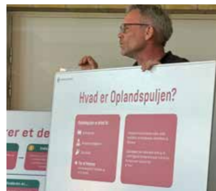
Preben fra borgmesterkontoret fortæller om oplandspuljen.

Kommunens to medarbejdere fra Teknik og Miljø opfordrede til at man går ind på bit.ly/Trige-Byskitser og svarer på spørgsmål, men når Treklang er på gaden er fristen overskredet, du kan dog gå ind på aarhus.viewer.dk/plan.niras.dk/plan/2#/125688 og læse detaljeret om ideer og planer.