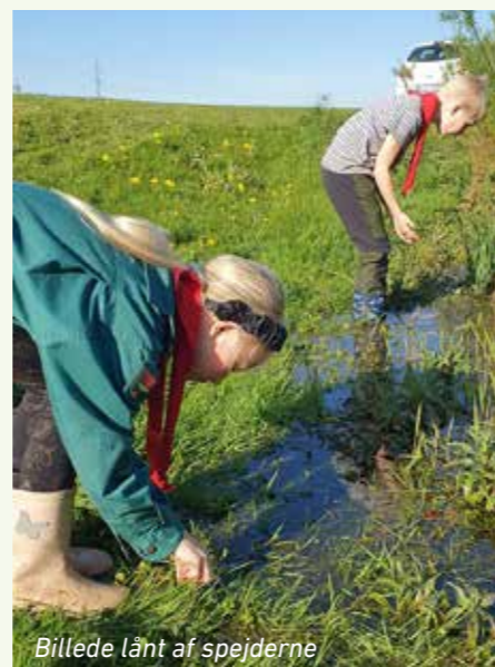
Billede lånt af spejderne