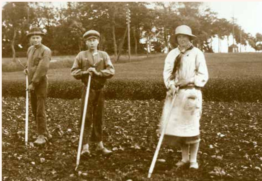
Roehakkere på Bakkegaardens mark ved Randersvej 1925, ca. der hvor Selmer Agro (John Dear) ligger i dag. I træerne anes Trige kirke. I baggrunden th. rutebilhuset.

Hvis du er interesseret i lokalhistorie og evt. deltage i arbejdet, så kom op og få en snak med os på arkivet.