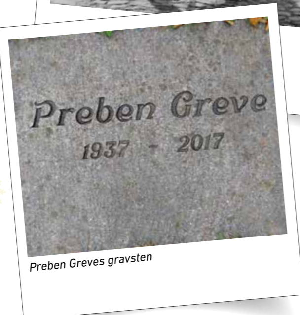
Preben Greves gravsten