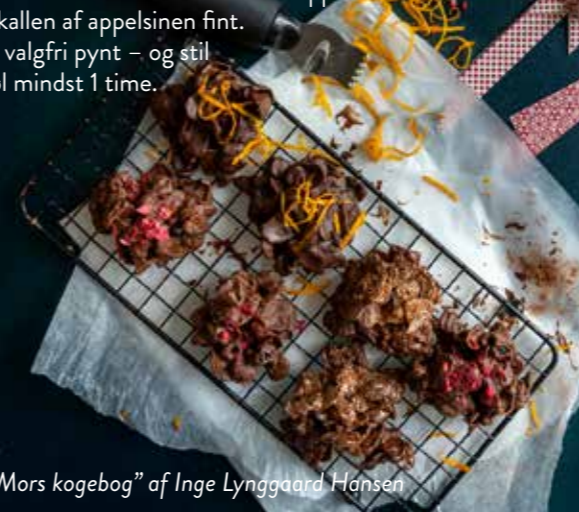
Fra "Mors kogebog" af Inge Lynggaard Hansen

Smelt chokoladen. Bland cornflakes og rosiner i chokoladen. Form i små toppe. Riv skallen af appelsinen fint. Vælg valgfri pynt – og stil på køl mindst 1 time.