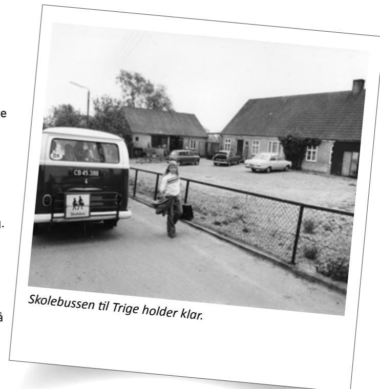
Skolebussen til Trige holder klar.